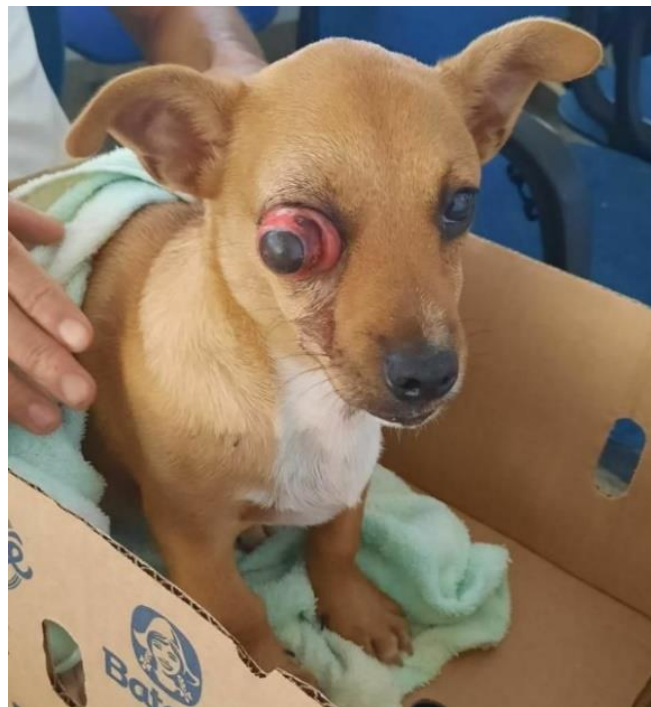
Figura 1: Globo ocular direito prolapsado em cadela filhote atendida no HVU - UFPI/CPCE.

Uma cadela, sem raça definida (SRD), de quatro meses de idade e pesando quatro quilos, foi atendida no Hospital Veterinário Universitário (HVU) da Universidade Federal do Piauí (UFPI), Campus Professora Cinobelina Elvas (CPCE). Na anamnese, o tutor relatou que no início do dia notou o animal com o olho direito inchado, demonstrando dor, sem interesse pelo alimento, triste e isolado. Vale ressaltar que essa alteração ocular havia surgido há mais de 12 horas antes do atendimento e o proprietário relatou que o animal convivia com outros cães já adultos. Ao exame físico, observou-se o globo ocular direito prolapsado com pupila não responsiva a estímulos fotomotores e sem reflexo consensual, conjuntiva hiperêmica, episclerite (inflamação do tecido episcleral superficial), córnea edemaciada, hematoma e hifema (acúmulo de sangue na câmara anterior do olho). A cadela também apresentou edema palpebral e presença de sujidades no olho afetado (Figura 1). Ademais, o animal apresentou frequência cardíaca de 180 bpm (batimentos por minuto), frequência respiratória de 40 mrm (movimentos respiratórios por minuto), temperatura retal de 36,8°C, grau de desidratação menor que 5%, TPC (tempo de perfusão capilar) menor que dois segundos, mucosas hipocoradas e linfonodos aumentados.