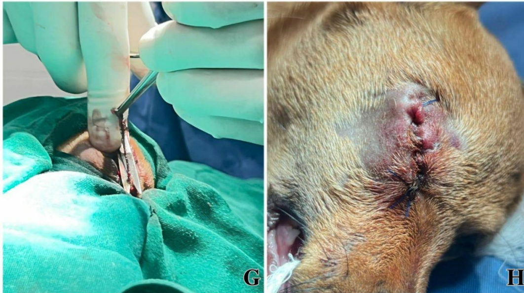
Figura 4: Ressecção das bordas palpebrais (G) e sutura simples contínua na pele (H).