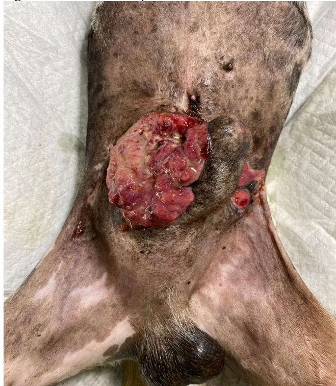
Figura 1. Lesão ulcerada por carcinoma de células escamosas.