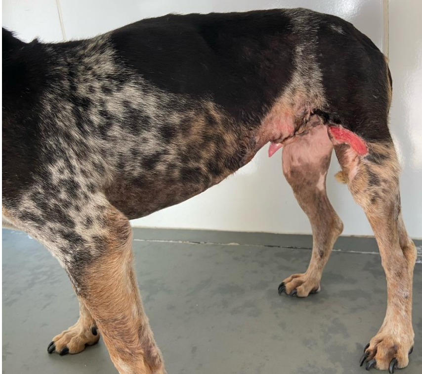
Figura 4. Recuperação, cicatrização pós cirúrgica e ausência de massa tumoral

Fonte: Arquivo pessoal, foto autorizada pela clínica. (2023)