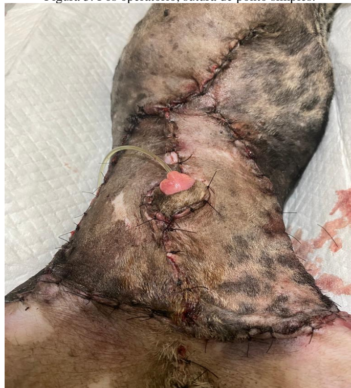
Figura 3. Pós operatório, sutura de ponto simples.