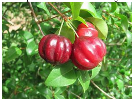
Figura 6 - Exemplar de frutos e folhas de Eugenia Uniflora