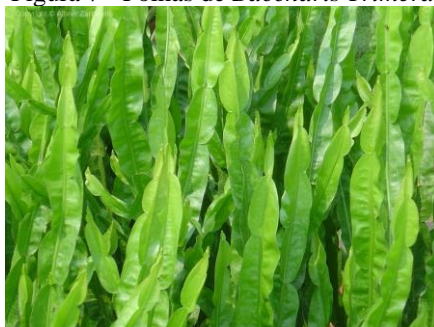
Figura 7 - Folhas de Baccharis Trimeria