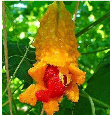
Figura 5 - Exemplar de frutos de Momordica Charantia