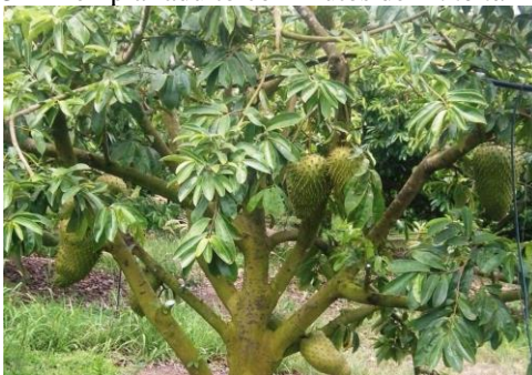
Figura 3 - Exemplar adulto com frutos de Annona Muricata