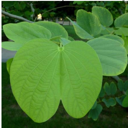
Figura 1 - Folhas da espécie Bauhinia Forficata