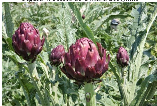
Figura 4: Flores de Cynara Scolymus