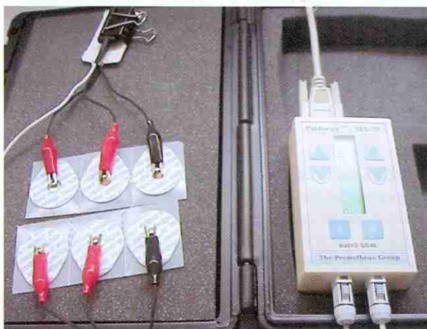
FIGURA 3 - Ilustração, à esquerda dos eletrodos de eletrocardiograma acoplados ao Aparelho de Biofeedback Eletromiográfico modelo Pathway MR-20, demonstrado à direita.

o ponto motor do músculo tibial anterior com o eletrodo terra acima e os demais abaixo.