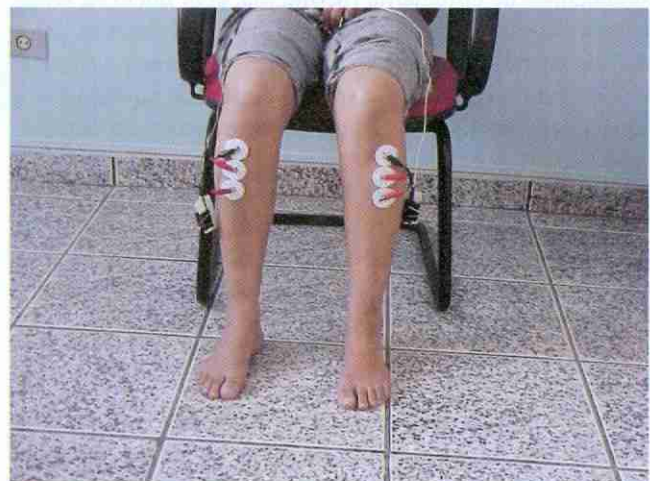
FIGURA 2B - Posicionamento bilateral dos eletrodos sobre

o ponto motor do músculo tibial anterior com o eletrodo terra acima e os demais abaixo.