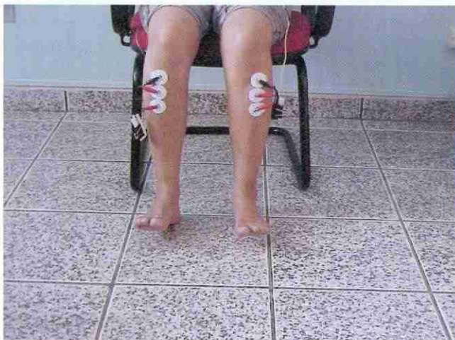
FIGURA 2A - Ilustração demonstrando posicionamento bilateral de eletrodos associado ao movimento de dorsiflexão do tornozelo.