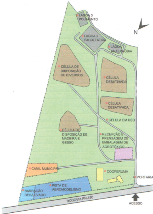
Figura 2: Planta de localização geral