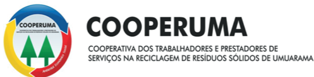
Figura 3: Logomarca da COOPERUMA