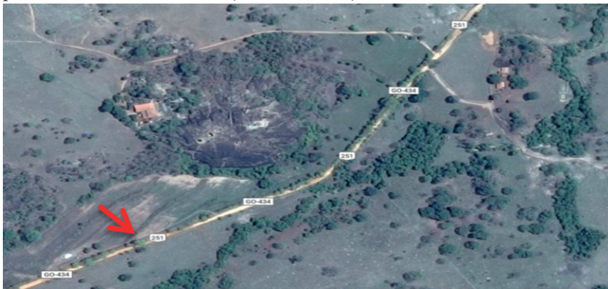
Figura 1: Localização da Comunidade Terapêutica Estudada, no município de Rubiataba- GO 434 (seta vermelha).