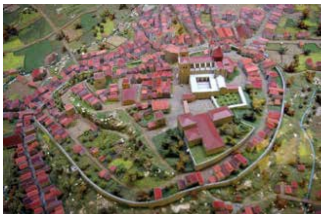
Figura 1: Exemplo de Planta de cidades Feudais (Idade Média).

O sentimento de planejar um território se evidenciou em uma necessidade eminente frente a tantos problemas formados a partir de uma organização ou uma comunidade a fim de dar vetores que norteavam as ações administrativas. Os planos Nacionais a priori, de forma global, se revelaram ineficazes num dado momento da história do planejamento. Atendiam, em primazia, à interesses das classes mais abastadas ou do poder local, que muitas das situações não atendiam a demanda de senso maior, afortunando os problemas de ordenamento já existentes, fomentando a existência de outros e implicando no social.